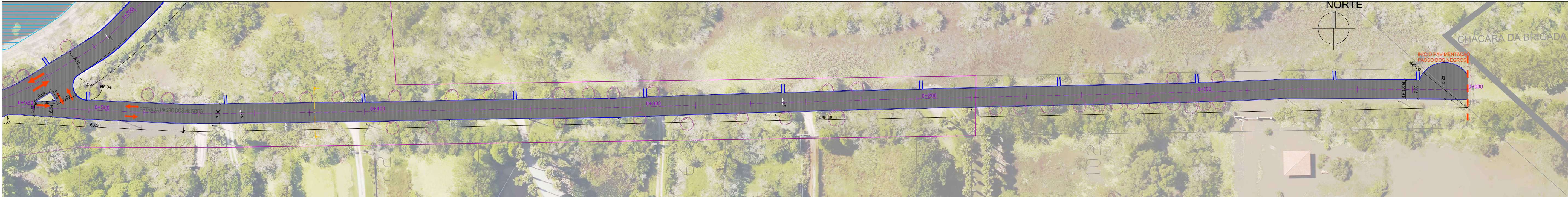
PLANTA BAIXA TRECHO 05 ESC. 1:750